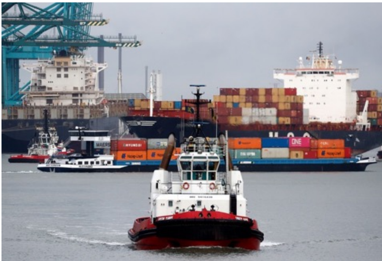
Vrachtschepen in de Antwerpse haven.